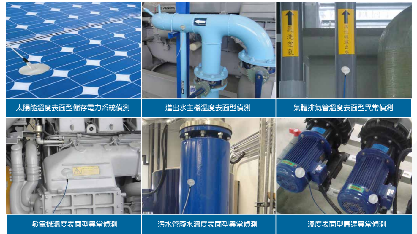
太陽能溫度表面型儲存電力系統偵測