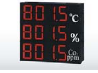
SD430數據顯示 警報傳輸