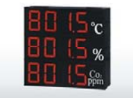
SD430數據顯示 警報傳輸