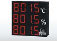
SD430數據顯示 警報傳輸